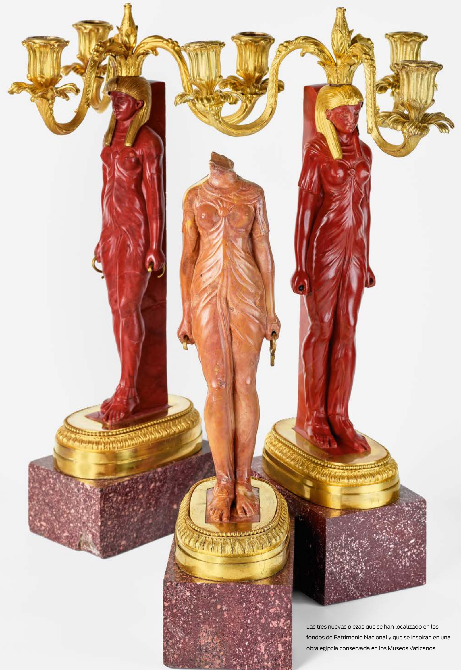
Las tres nuevas piezas que se han localizado en los fondos de Patrimonio Nacional y que se inspiran en una obra egipcia conservada en los Museos Vaticanos.

El dessert permaneció íntegro en la Colección Real hasta la fundación en 1819 del Real Museo de Pintura y Escultura –actual Museo Nacional del Prado–, momento en que parte de sus pequeñas arquitecturas fueron trasladadas