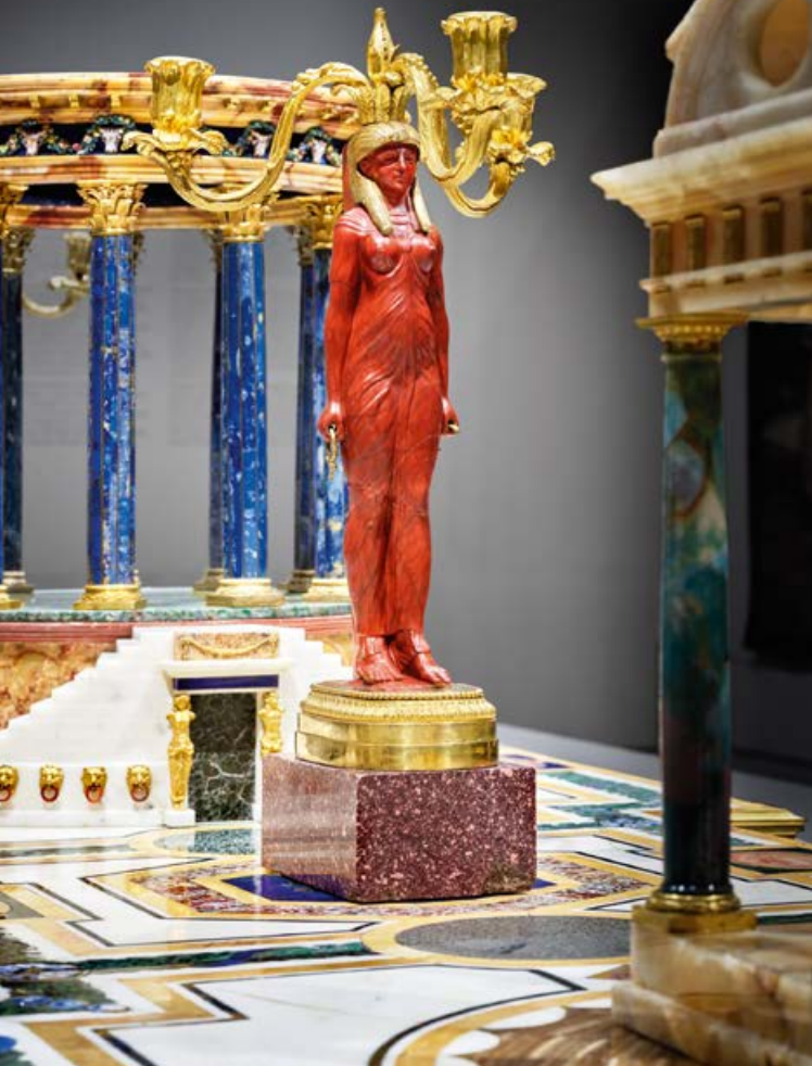
Detalle de uno de los candelabros aquí atribuidos en su colocación actual.

aunque no se aprecie en el grabado. Este soporte está presente en las obras del mismo conjunto reproducidas en el libro, donde se indica que esas estatuas «en la parte trasera, poseen una banda tallada en la misma pieza de mármol, a modo de pilar, sobre la que se apoyan» 12 . Estas esculturas fueron más veces fuente de inspiración para Valadier: como se demuestra en el dessert de San Petersburgo, donde una de las figuras 13 copia al Osiris-Antínoo de los Museos Vaticanos, también reproducido en la citada publicación 14 .