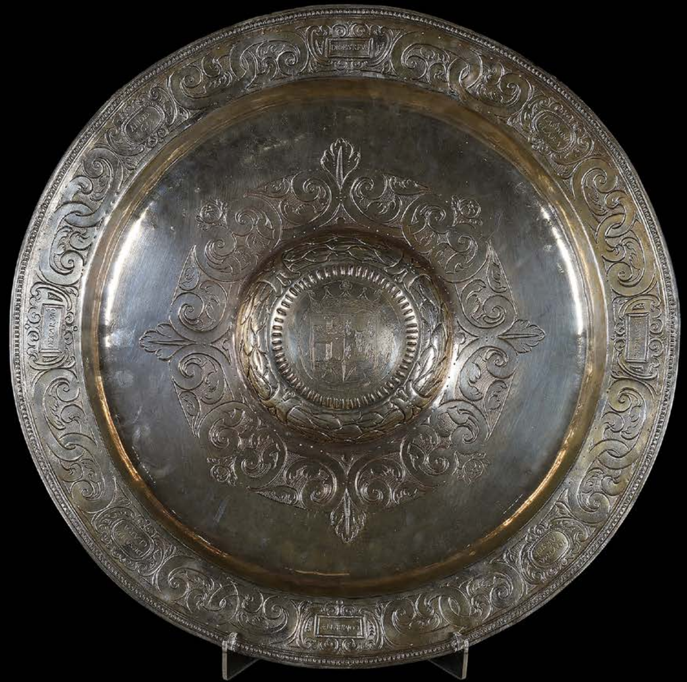
Importante plato petitorio realizado en plata. Dentro de las cartelas del borde reza la leyenda: "DIO ESTA FUENTE" - "LA S(EN)ORJA. DOÑA CLARA" - "DE SOTOMAIOR" - "IGVSMA (I GUZMÁN) A ESTE" - "GOMBENTO" - "DE SANTA CLARA" - "DE CARMO(N)A" - "AÑO DE 1653". En el tetón central aparece el escudo de la Orden Franciscana. Época: S. XVII Medidas: 52 cm

La identificación de estas piezas permite no solo ampliar el corpus conocido del dessert de Carlos IV, sino también comprender mejor su compleja configuración formal y simbólica. Lejos de ser meramente decorativas, este tipo de obras funcionaba como un sofisticado dispositivo en el que convergían erudición arqueológica, virtuosismo técnico y gusto cortesano. La recuperación y estudio de estos candelabros contribuye, por tanto, a reforzar la lectura del conjunto como una creación absolutamente unitaria, en la que cada elemento desempeñaba un papel preciso dentro de un programa estético y funcional cuidadosamente concebido.