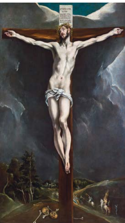
El Greco. Crucificado. Hacia 1590. Óleo sobre lienzo. 178 x 104 cm. Colección Casacuberta Marsans.