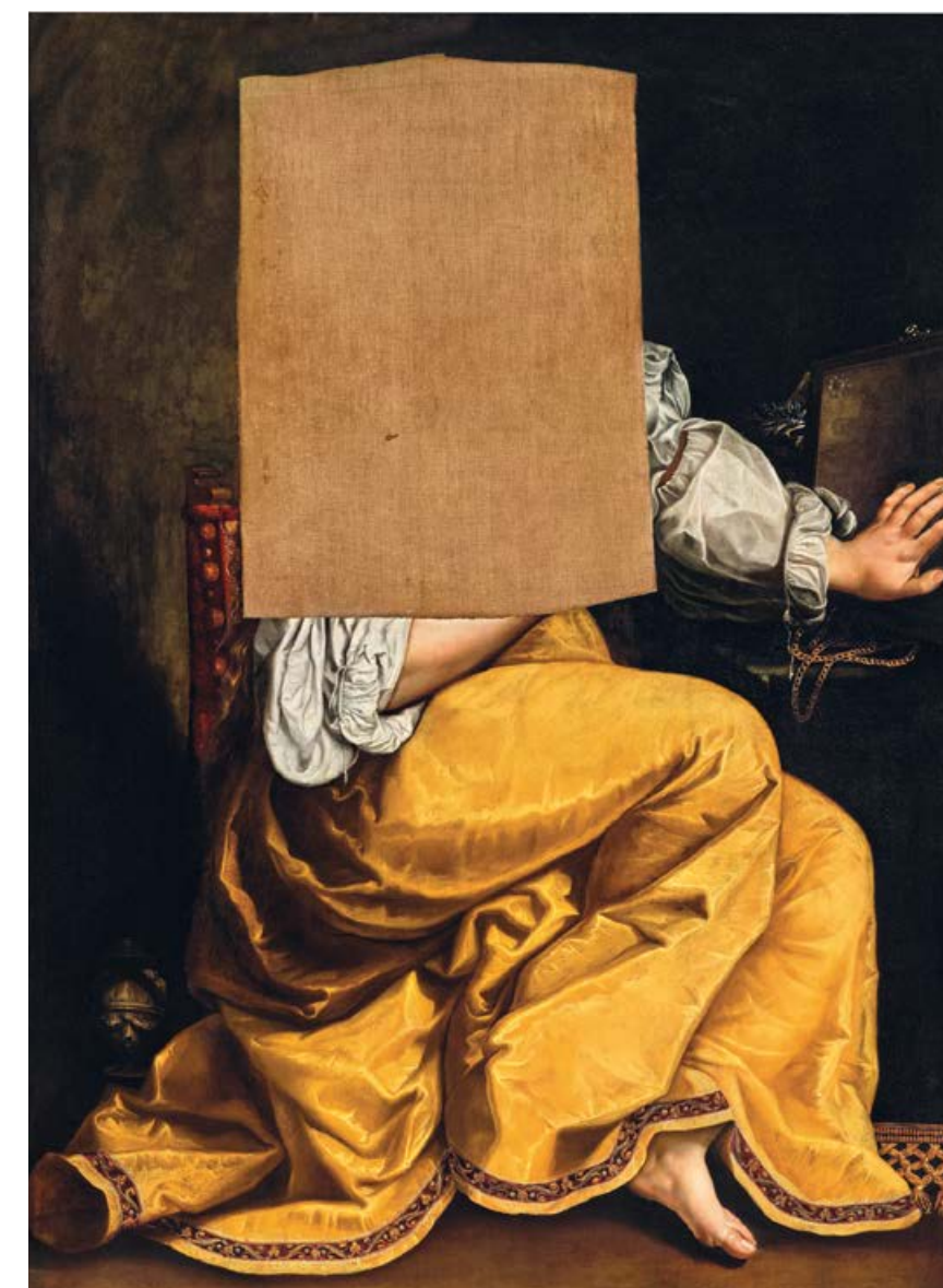
Artemisia Gentileschi. María Magdalena (fragmento). Óleo sobre lienzo. 148 x 111 cm. Remate: 837.500 euros.

Estamos inmersos en la IA y aunque hay claras ventajas con esta tecnología y muchos me animan