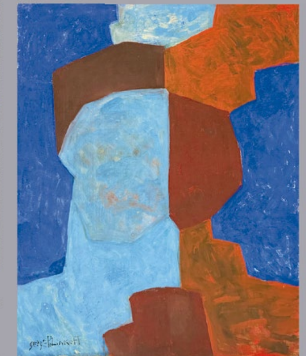
Serge Poliakoff Composition abstraite , 1967 Óleo sobre lienzo 92 x 73 cm