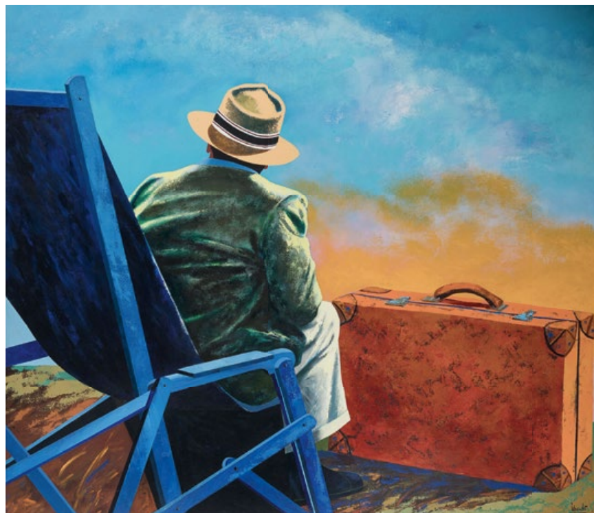
Eduardo Úrculo. El australiano. 1991. Óleo sobre lienzo. 130 x 162 cm. Remate: 60.000 euros.

la subasta de arte contemporáneo de marzo de 2019 también en Sotheby's por 5.442.200 libras. Contando las comisiones y la inflación acumulada, esta fue una transacción con unas pérdidas de más de un millón de libras. Además de ellos dos, el otro gran protagonista de la sesión fue ROY LICHTENSTEIN , con seis pinturas procedentes de la colección privada de su viuda. Los diez lotes que acumularon entre los tres autores alcanzaron una cifra de ventas del 33% del total subastado.