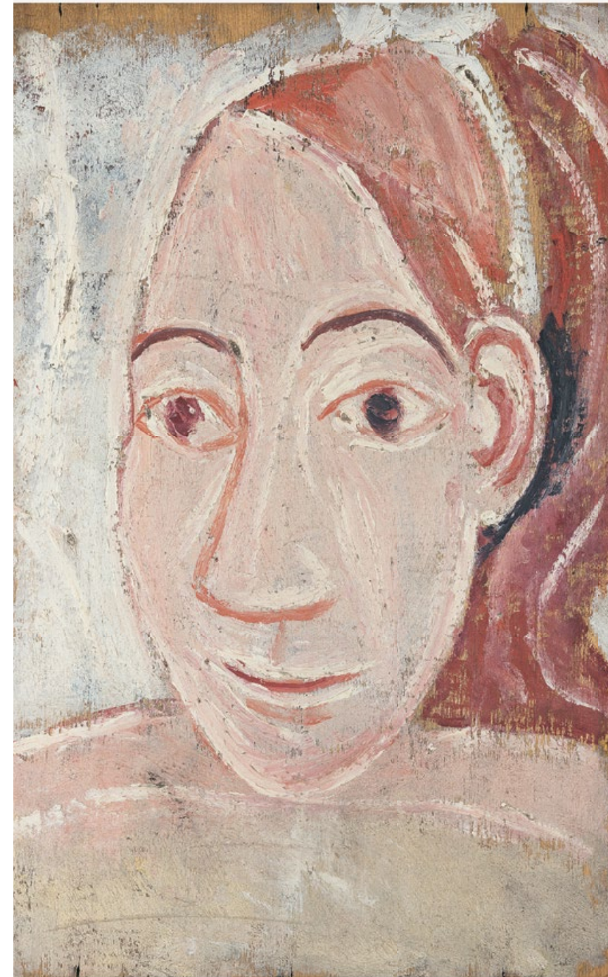
Pablo Picasso (1881-1973). Cabeza de mujer. París, otoño 1906. Óleo sobre madera, 25,6 x 16,5 cm. Fundación Almine y Bernard Ruiz-Picasso, Madrid