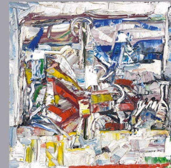
Jean-Paul Riopelle Sin título , 1964 Óleo sobre lienzo 60 x 60 cm