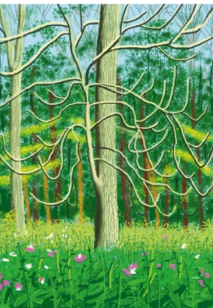
David Hockney. The Arrival of Spring in Woldgate, East Yorkshire. 2011. Dibujo para iPad impreso en papel, en cuatro partes, montado sobre Dibond. 236,2 x 177,8cm. Remate: 504.000 libras.

Hablando del mercado, la actualidad de las subastas estuvo en el cierre de curso el pasado mes de junio en Londres. El día 24 tuvo lugar en SOTHEBY'S la sesión de arte moderno y contemporáneo con una facturación de 64,4 millones de libras, lo que supuso un retroceso del 26% con respecto a la misma subasta del ejercicio anterior. La mitad del total rematado fue resultado de la adjudicación de los cinco lotes que lograron los precios más altos, demostrando así un nivel de concentración de riesgo medio. El tercero del top five fue una obra de JEAN-MICHEL BASQUIAT vendida por 6,6 millones de libras, mientras que el quinto fue una pintura de tres metros de alto de la Young British Artist JENNY SAVILLE con un precio de 5,4 millones. Esta obra, titulada Juncture , fue adquirida por el que había sido su propietario hasta entonces en