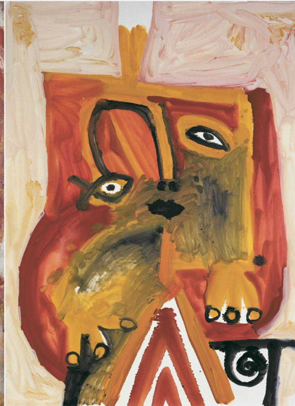
Pablo Picasso (1881-1973). Personaje. Mougins, 30 diciembre 1971. Pintura al óleo modificada sobre lienzo, 130 x 97 cm. Fundación Almine y Bernard Ruiz-Picasso, Madrid