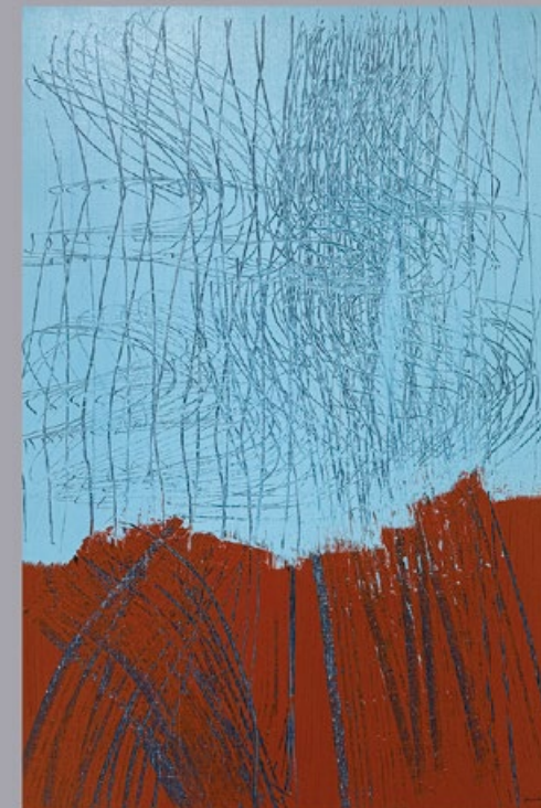
Hans Hartung T1969-H23 , 1969 Pintura vinílica sobre lienzo 73,2 x 50 cm