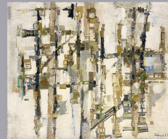
Maria Helena Vieira da Silva Composition , c. 1953-54 Óleo sobre lienzo 45,7 x 55,2 cm