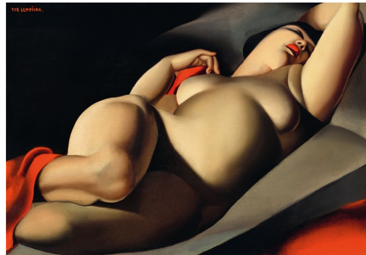
Tamara de Lempicka. La bella Rafaela. 1927. Óleo sobre lienzo. 64,2 x 91,3 cm. Remate: 7,47 millones de libras.