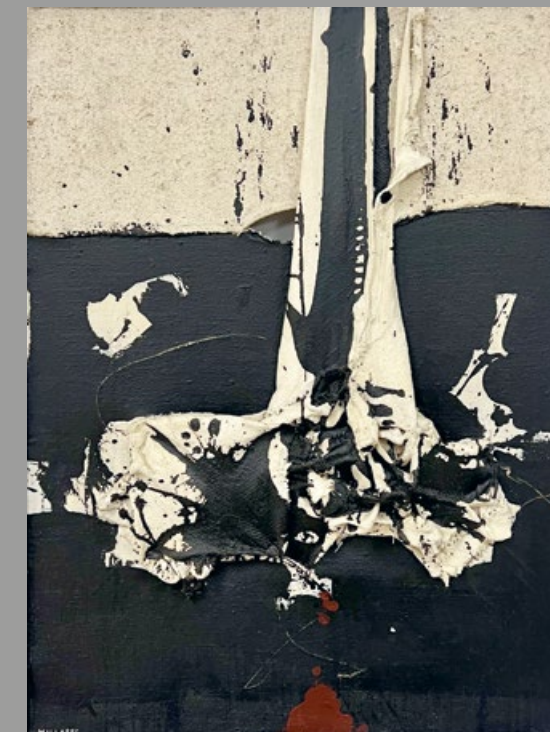
Manolo Millares Cuadro 194, 1962 Técnica mixta sobre arpillera 130 x 97 cm