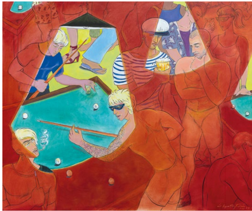
Rocío García. La apuesta. 2023. Óleo sobre lienzo.

volumen tan igualado y, bajo esta perspectiva de análisis, una evolución positiva con respecto a los resultados de las mismas categorías del año anterior. Se anotan un incremento del 48% y del 32% respectivamente.