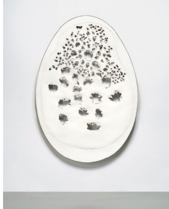
Lucio Fontana. Concetto spaziale, La fine di Dio. 1963. Óleo sobre lienzo. 178 x 123 cm. Remate: 20,5 millones de dólares.

Una hora antes el mismo día también en Sotheby's, se celebró la subasta The Now, la venta especializada en arte producido en los últimos 20 años. Con el distintivo de propuestas más innovadoras, alcanzó 55,2 millones de dólares en remates, lo que supone un avance del 20% con respecto a 2022. El lote de mayor valor fue para una pintura de JENNY SAVILLE con un precio de 10,9