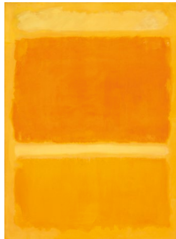
Mark Rothko. Untitled (Yellow, Orange, Yellow, Light Orange) . 1955. Óleo sobre lienzo. 207 x 152,5 cm. Remate: 46 millones de dólares.

El gran protagonista fue Femme à la montre de PABLO PICASSO . Con un precio de 139,3 millones de dólares, se convirtió en la obra más cara del año pasado adjudicada en venta pública. Esta pintura de 1932 construye una significativa conexión con su homóloga datada en 1939 de Peggy y, por tanto, entre la venta de ambas colecciones separadas por casi 60 años. En el ranking de lotes de mayor valor