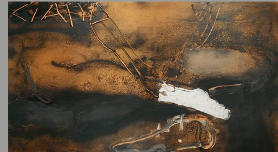
Antoni Tàpies Calçatín blanco, 1989 Pintura, barniz y collage sobre tabla 100 x 175cm