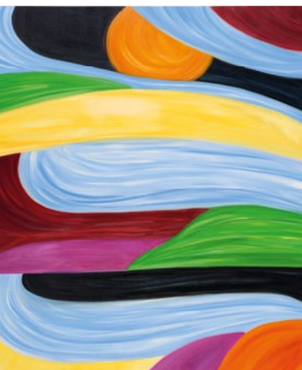
Marina Pérez Simão. Untitled. 2022. Óleo sobre lienzo. 199 x 169,9 cm. Remate: 422.000 dólares.