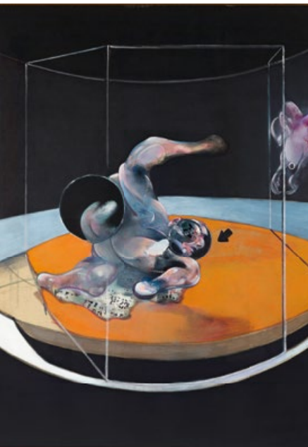
Francis Bacon. Figure in Movement . 1976. Óleo y tinta transferida a lienzo. 198,9 x 147,3 cm. Remate: 52 millones de dólares.