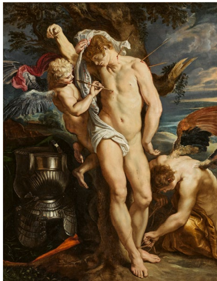
Peter Paul Rubens. San Sebastián atendido por dos ángeles. Óleo sobre lienzo. 124 x 97,8 cm. Remate: 4,9 millones de libras.

Los 'guarantees' o lotes garantizados comenzaron su andadura en la eterna lucha de los dos titanes del mercado mencionados. En un momento dado, cuando se debatían por la atención de los propietarios interesados en vender la obra maestra de turno, comenzaron a ofrecer un trato que nadie podía rechazar: si no encontraban pujadores, la misma casa de subastas les pagaría el precio acordado. Como es lógico, la competencia llevó a aumentar estas cifras progresivamente en lo que eran apuestas muy arriesgadas. Las cifras de estas ventas garantizadas llegaron a superar las estimaciones más altas de las piezas y una subasta desafortunada supuso la quiebra de Phillips en 2001.