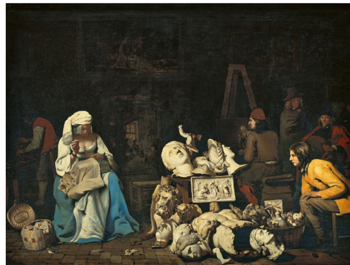
Michael Sweerts. El estudio del artista con una costurera. Óleo sobre lienzo. 79,5 x 108,4 cm. Christie's Images LTD 2023. Remate: 12,6 millones de libras.