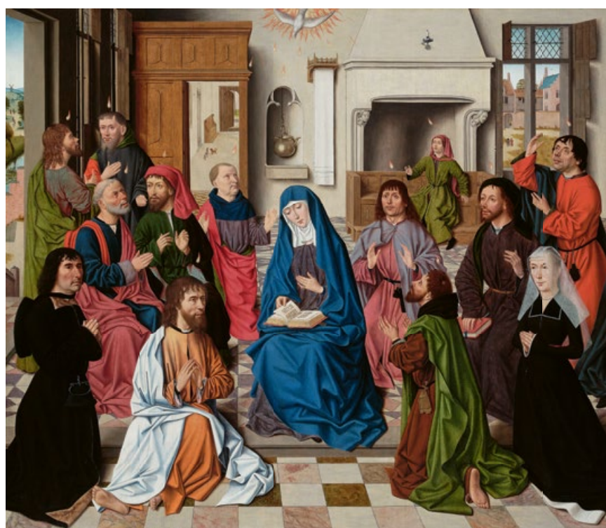
Baroncelli. Pentecostés. Óleo sobre tabla. 106 x 122 cm. Remate: 7,9 millones de libras.