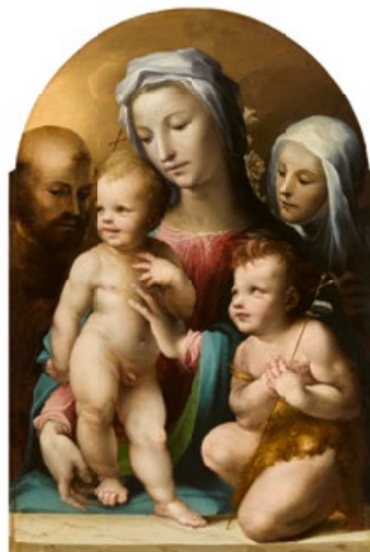
Domenico Beccafumi. Virgen con el Niño, san Juanito, san Francisco y santa Catalina de Siena. Óleo sobre tabla. 85,7 x 57,8 cm. Remate: 5,1 millones de libras.

Todo esto viene a cuento porque en el mercado del arte también estamos viviendo unos meses extraños y porque la dependencia del sector financiero es cada vez mayor. Por eso, en nuestro fallido papel de Cassandra, a lo que está ocurriendo lo llamamos «reajuste» y evitamos decir «caída», pero nos entendemos. Con o sin eufemismo vender malas noticias es fácil. Y aunque es cierto que de manera casi unánime los que nos dedicamos a analizar el mercado estamos viendo posibles problemas en el horizonte, acertaremos solo un 50% de las veces.