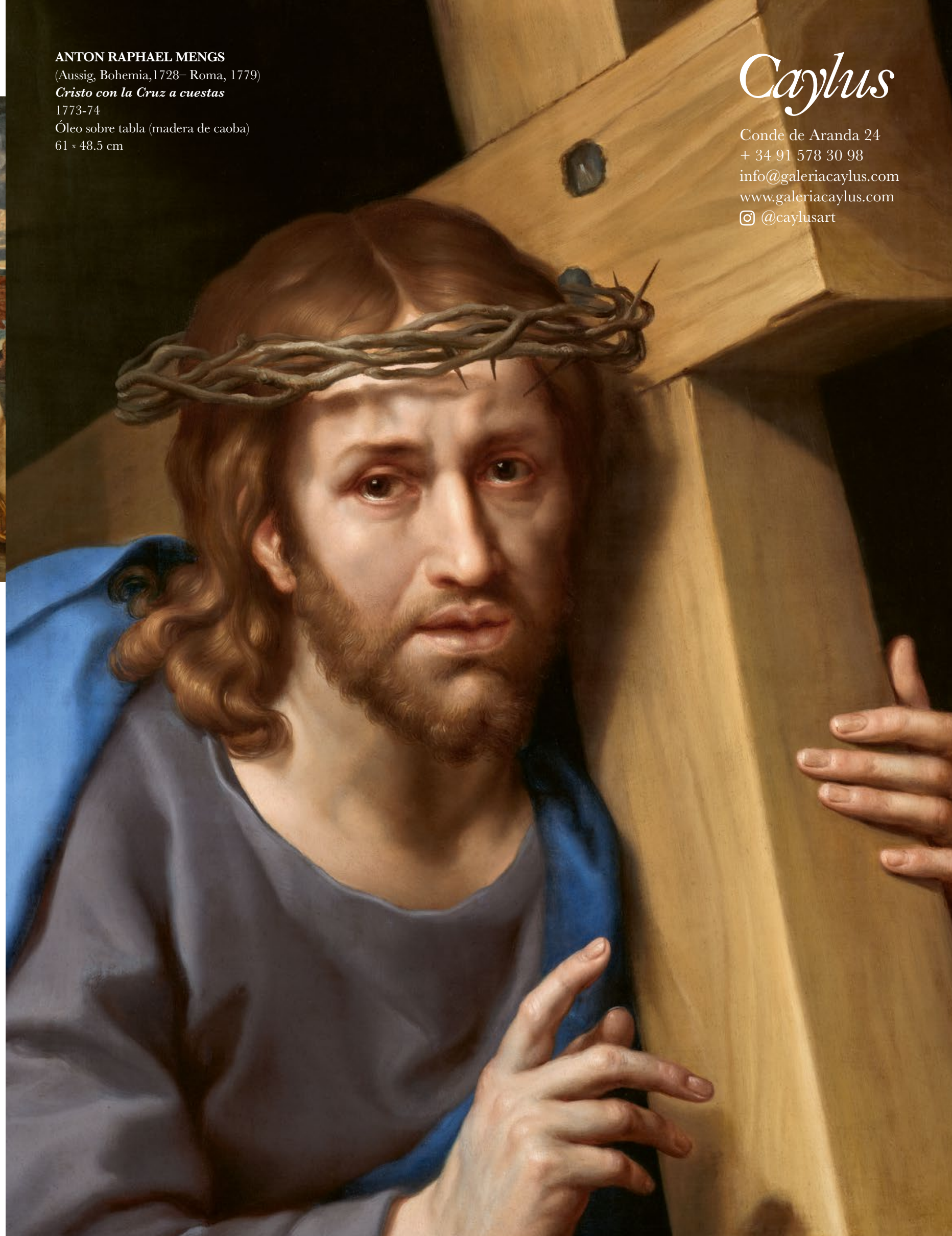
ANTON RAPHAEL MENGES (Aussig, Bohemia, 1728– Roma, 1779) Cristo con la Cruz auestas 1773-74 Óleo sobre tabla (madera de caoba) 61 x 48,5 cm

En los últimos años los guarantees han vuelto con más fuerza que nunca, pero con una modificación: ya no es la propia casa de subastas la que respaldaba la obra en caso de quedar invendida, sino un inversor ajeno a ellas. Mientras estos últimos sean agentes del mercado del arte, siempre hay final feliz: si la obra no se vende, se la habrán quedado por una cantidad razonable y apalabrada