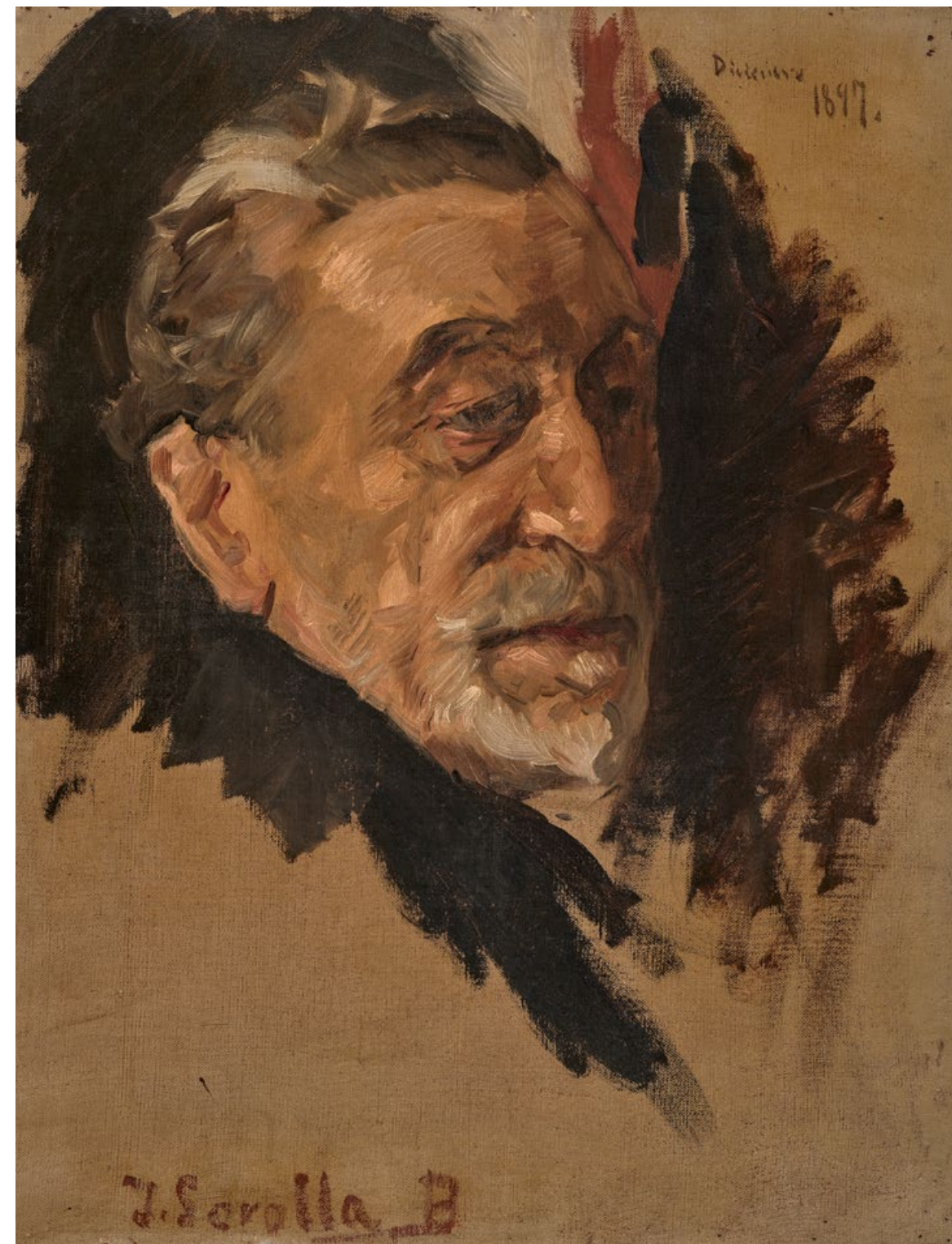
JOAQUÍN SOROLLA (1863-1923) Práxedes Mateo Sagasta

PINTURA ANTIGUA SIGLOS XVI-XVII-XVIII-XIX