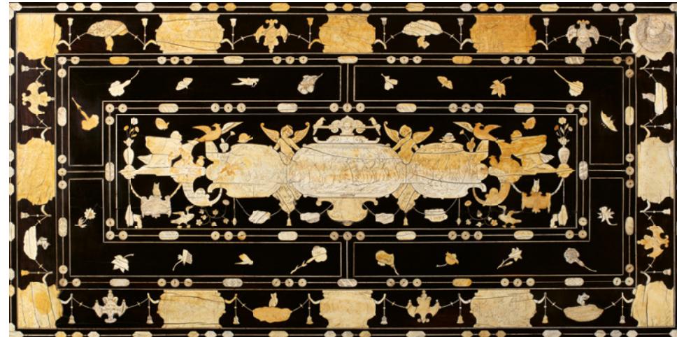
Manufactura napolitana. Bufete plegable con las armas de los VII condes de Lemos. Última década del siglo XVI o principios del XVII. Madera de pino chapeada en ébano y guarnecida de placas de marfil. 72 x 131 x 65,5 cm. Colección particular.

A la narración bélica se suman querubines alados, gansos, búhos, ardillas, mariposas, águilas y diferentes especies florales y vegetales que manifiestan alegorías relacionadas con el poder y la guerra, la protección, la inmortalidad, la sabiduría o la prosperidad.